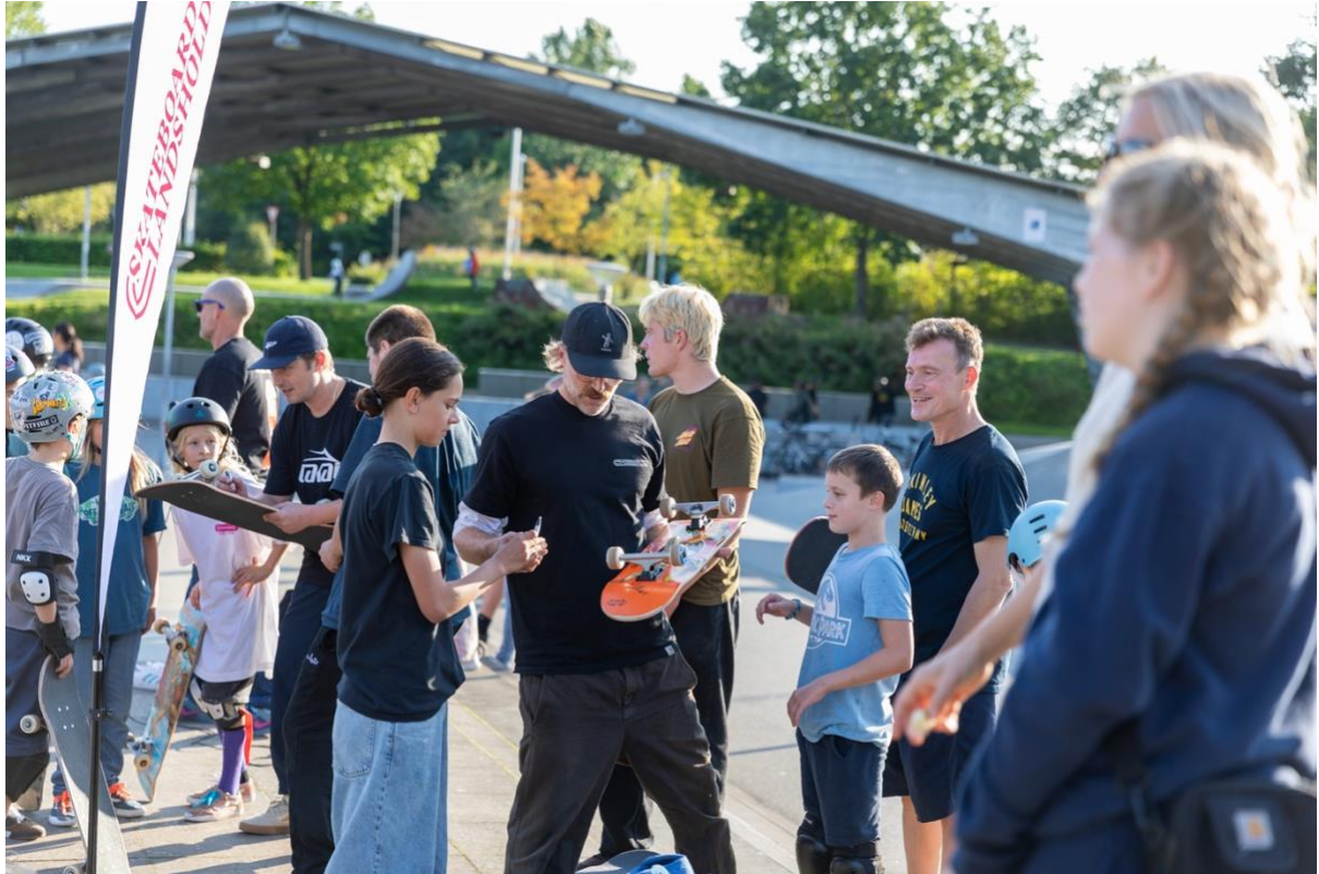
Billede 5: Autografer og selfies er vigtige, og man skal som landshold tage sig tid til det (og huske masser af tuscher!)