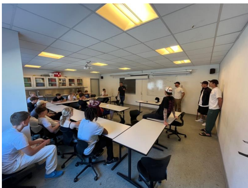
Billede 11: På Billeshave Efterskole havde vi - udover social skate - en gæsteoptræden i undervisningen på skatelinjen. Der blev talt om landsholdsmuligheder og god træning.