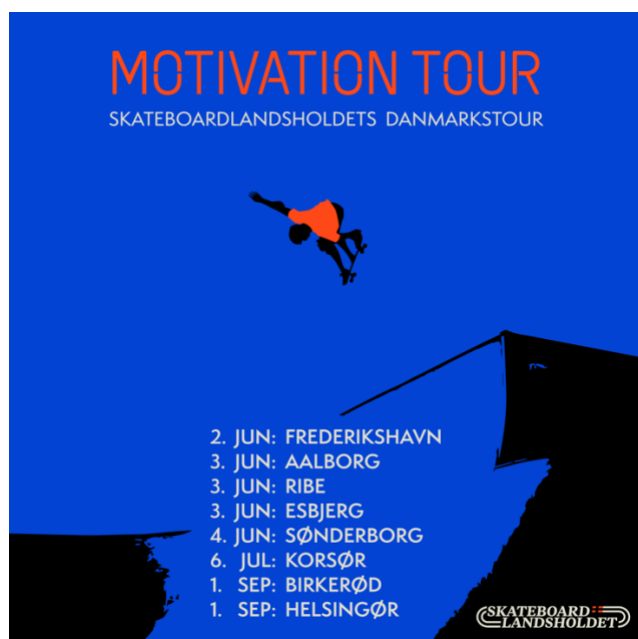
Billede 12: En af vores PR-billeder til deling på de sociale kanaler

Den lokale opmærksomhed er altafgørende, og kan altid blive bedre.