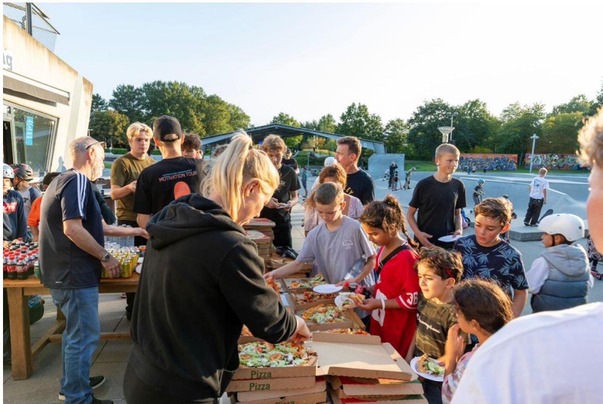
Billede 9: Fællesspisning er en super måde at møde hinanden på. Her i Multiparken i Helsingør hvor de lokale kræfter fra kommunen var en kæmpe hjælp og inspiration

Alle steder spiste vi med de lokale. Det er hyggeligt og socialt. Vi vil anbefale at have det som en del af et arrangement – kan også blot være en vand og noget frugt. Men det skal ikke være det der tiltrækker folk. Vi vil ikke anbefale, at det kommer på reklamerne for arrangementet, da det kan flytte fokus fra det primære (i vores tilfælde bevægelse og sammenhold). Det der virker bedst, er forsmurte sandwiches eller pizzaer.