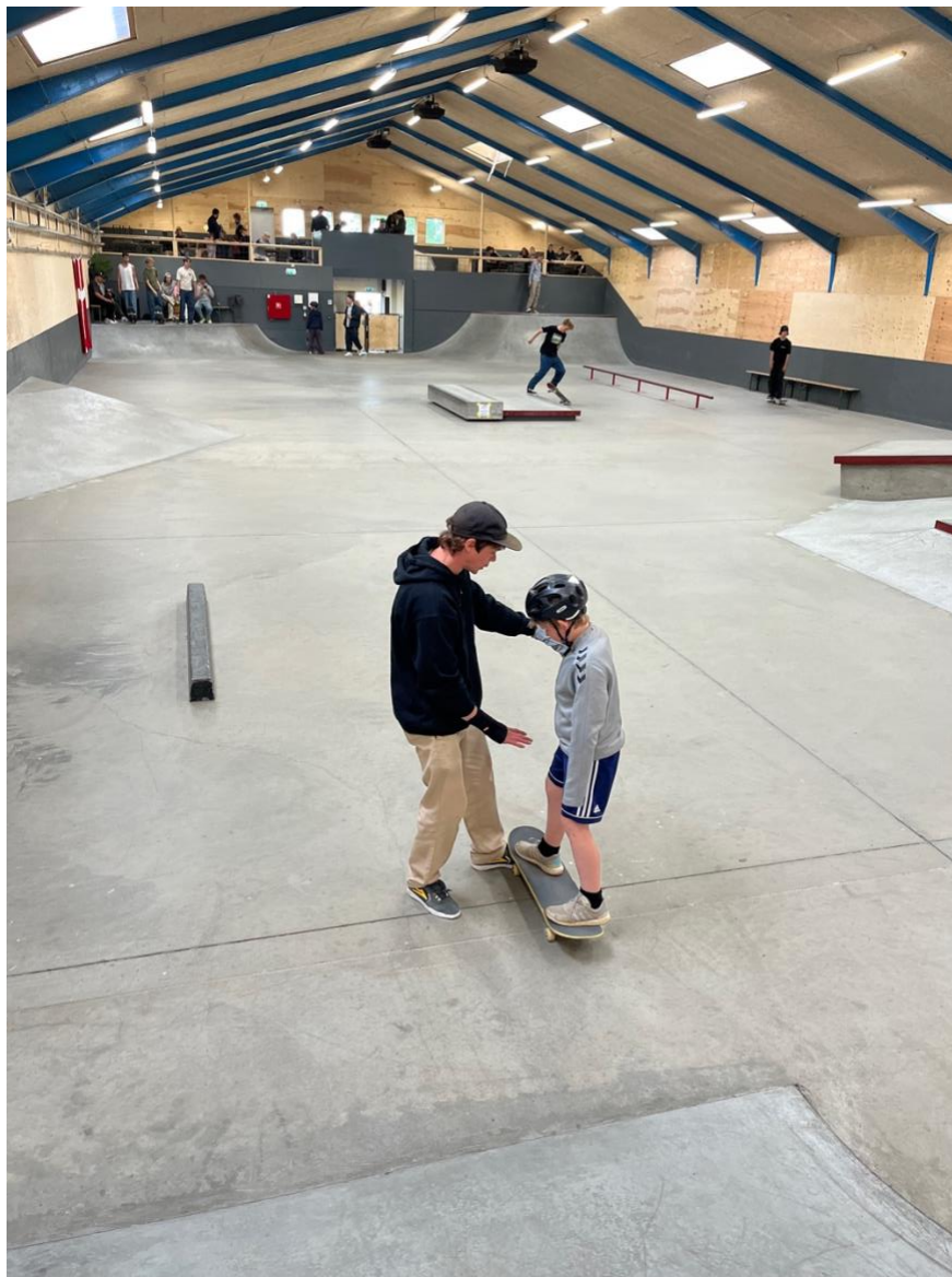
Billede 7: Atlet og landstræner Mads Christensen lærer en deltager i Sønderborg at stå på skateboard for første gang

Vi kan dog høj grad anbefale uformelle workshops, som fx det at lære at skate af en landsholdsatlet.