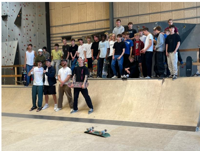
Billede 10: Landsholdet sammen med skatelinjen på Billeshave Efterskole.

Vi vil meget gerne på flere surprise visits, og kan anbefale alle at gøre det. De små lokale møder kan have en større effekt på den enkelte, end helt store events.