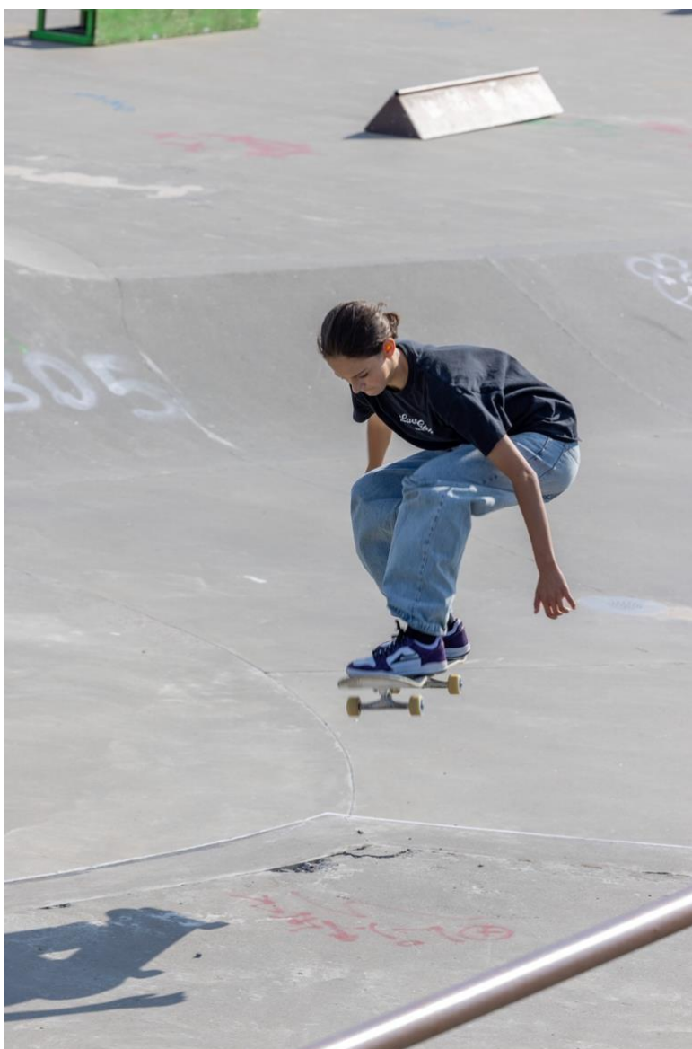
Billede 1: Smilla Alsbirk fra landsholdet er flyvende

Det vil være oplagt at komme ud på fx skoler og fortælle om DIY-kulturen i skateboarding, og hvordan den kan oversættes til andre sammenhænge. Tankegangen er ikke afhængig af om hvorvidt man står på skateboard.