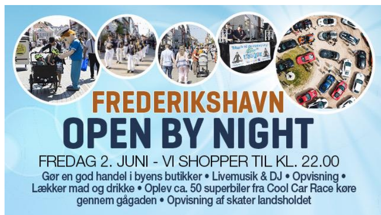
Billede 13: Kan man lave arrangementet som en del af et større arrangement kommer der flere besøgende.