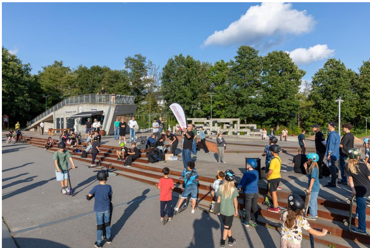
Billede 4: Det er super vigtigt - især inden for skateboard - at der er en speaker til opvisningerne: En som kan fortælle hvem der er hvem, og hvilke tricks der bliver lavet. Derudover en som kan være med til at forkorte afstanden mellem eliten og bredden. Husk grin

Vi havde en kommentator med til alle stederne, som forklarede publikum hvem der var hvem og hvilke tricks de lavede. Opvisning fungerede meget fint og skal stadig være en hovedbegivenhed.